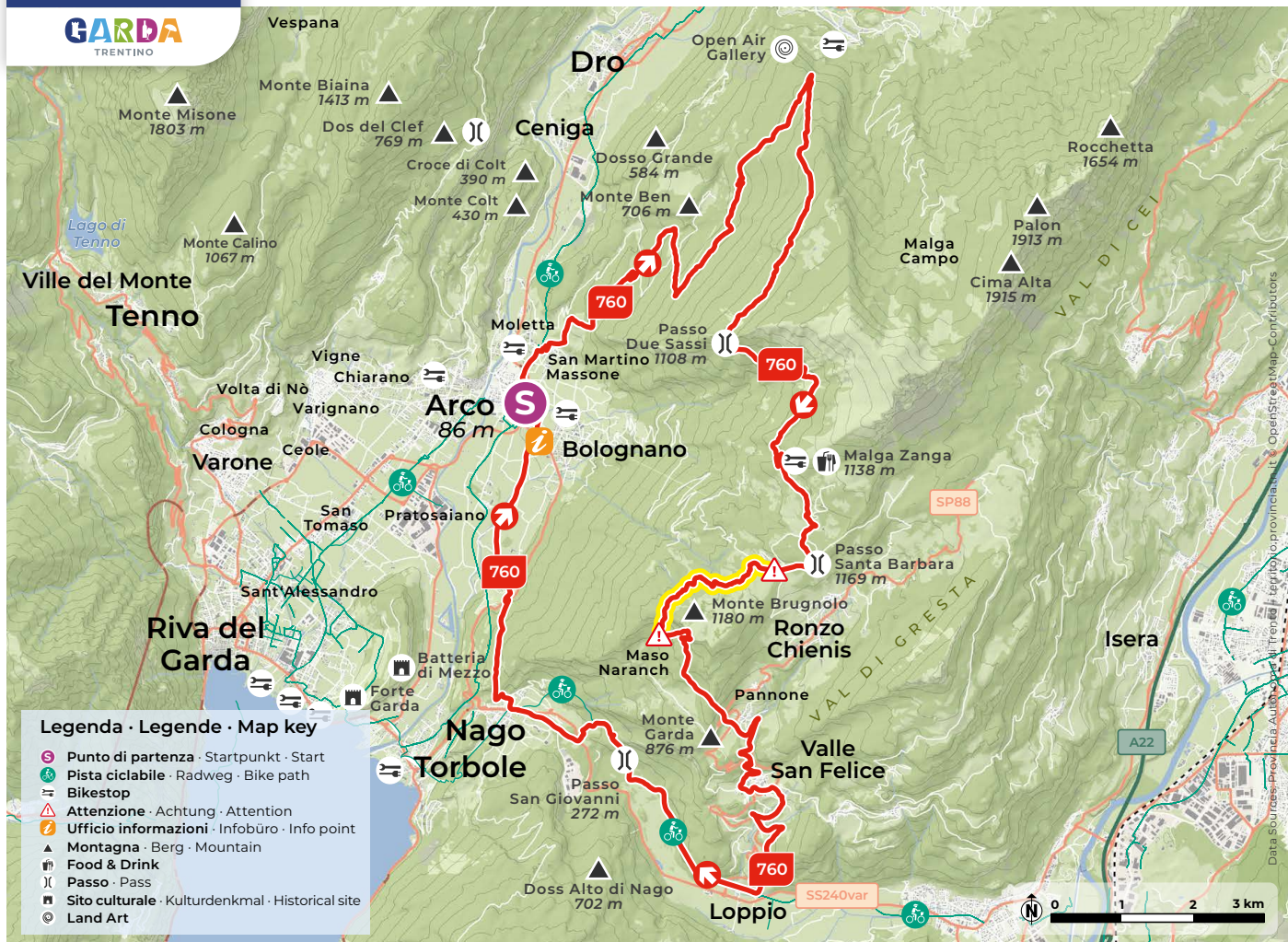
Design and cartography 2023 | max2.at

MTB Un giro perfetto per un'esperienza indimenticabile. Lunghe salite, elettrizzanti discese, belle vedute e paesaggi diversi, nonché un'interessante variante: tutto compreso nel giro. Da Arco si parte come per il tour 759 passando per San Martino e Carobbi fino al Passo Due Sassi, per poi proseguire fino a Malga Zanga e Santa Barbara. Da qui parte una variante attraverso il sentiero Maso Naranch, raccomandata solo ai più esperti. Dopo un giro attorno al Monte Creino a ovest, attraverso bellissimi sentieri si arriva al Maso Naranch, ottimo luogo per concedersi una sosta di ristoro. Da qui non si scende direttamente a Nago, ma si attraversa prima la Val di Gresta, famosa per le sue coltivazioni biologiche. L'interessante discesa verso Loppio si dipana su vie carrabili in parte asfaltate e in parte sterrate. Percorsa la pista ciclabile fino a Nago, si scende comodamente fino al punto di partenza ad Arco.